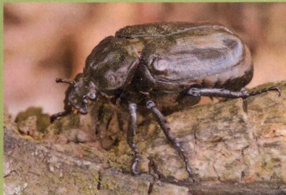
silně ohrožený páchník hnědý

Krajský úřad v této souvislosti nabízí ve sporných případech obecním úřadům pomoc. Není-li zřejmé, zda je určitý strom obýván zvláště chráněnými druhy, mohou se obecní úřady obrátit na Krajský úřad Pardubického kraje, oddělení ochrany přírody, který jim pomůže sporné případy řešit. Krajský úřad se pokusí v takových případech předat obecním úřadům odborné informace, případně zprostředkuje konzultace se subjekty, které se touto problematikou v terénu přímo zabývají (např. Agentura ochrany přírody a krajiny ČR, odborná zájmová sdružení apod.).