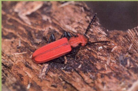
silně ohrožený lesák rumělkový

Seznam zvláště chráněných živočichů je uveden v Příloze č. III vyhlášky MŽP č. 395/1992 Sb., kterou se provádějí některá ustanovení zákona. Nelze předpokládat, že by každý obecní úřad povolující kácení byl schopen determinovat všechny druhy zvláště chráněných živočichů uvedených v této vyhlášce, případně poznat jejich pobytové značky, zejména bezobratlých živočichů.