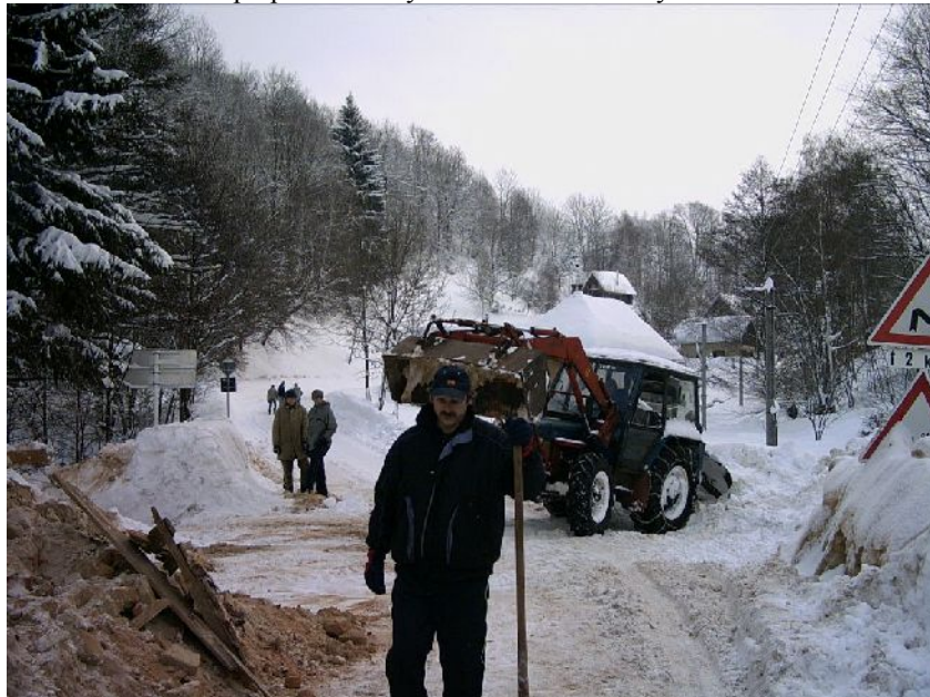
Dobrovolní hasiči a jiní dobrovolníci při Odklizení sněhu z KD v Cotktyli

Úklid komunikace po pádu střechy v Herborticích členy SDH.