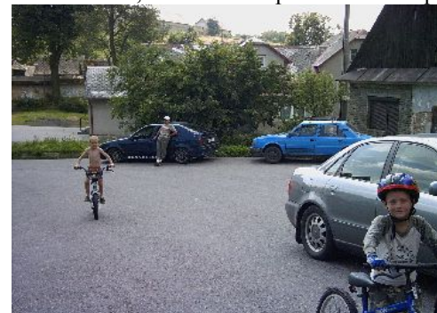
Auta v době zákazu stání před OÚ Cotkytle

V poslední době si stále více stěžují řidiči autobusů na neukázněné řidiče, kteří nerespektují dopravní značení „ZÁKAZ STÁNÍ“ v době od 12:00 do 16:00 hod. Nejvíce mne zaráží, že jsou to právě zdejší občané, kteří vědí, kdy autobus přijíždí a jak těžké je se na přeplněném prostoru před OÚ Cotkytle otáčet. Zřejmě bude nutné, aby v tuto dobu byla přivolána hlídka Policie ČR z Lanškrouna, která bude neposlušné řidiče pokutovat.