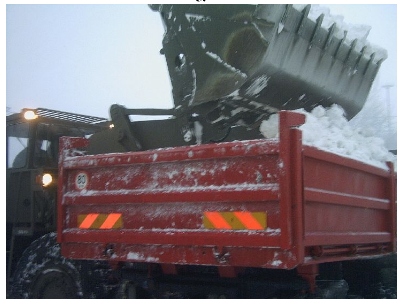
Tři lžíce nakladače naplnili celé nákladní auto.