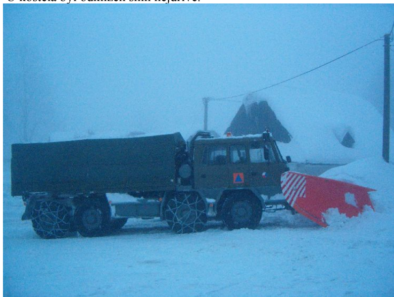
Osmikolka se šípovým pluhem byla velkým pomocníkem.