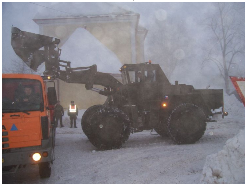
U kostela byl odklizen sníh nejdříve.