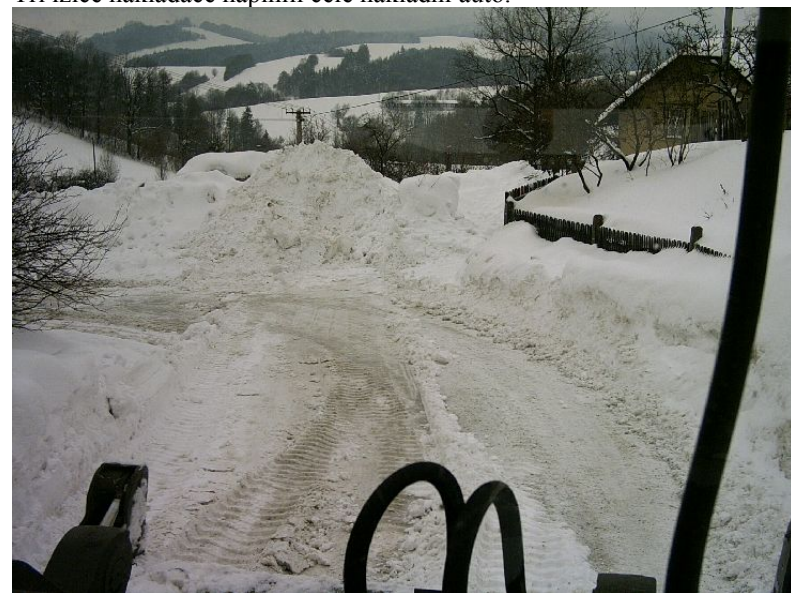
Pohled z místa řidiče kolového nakladače.