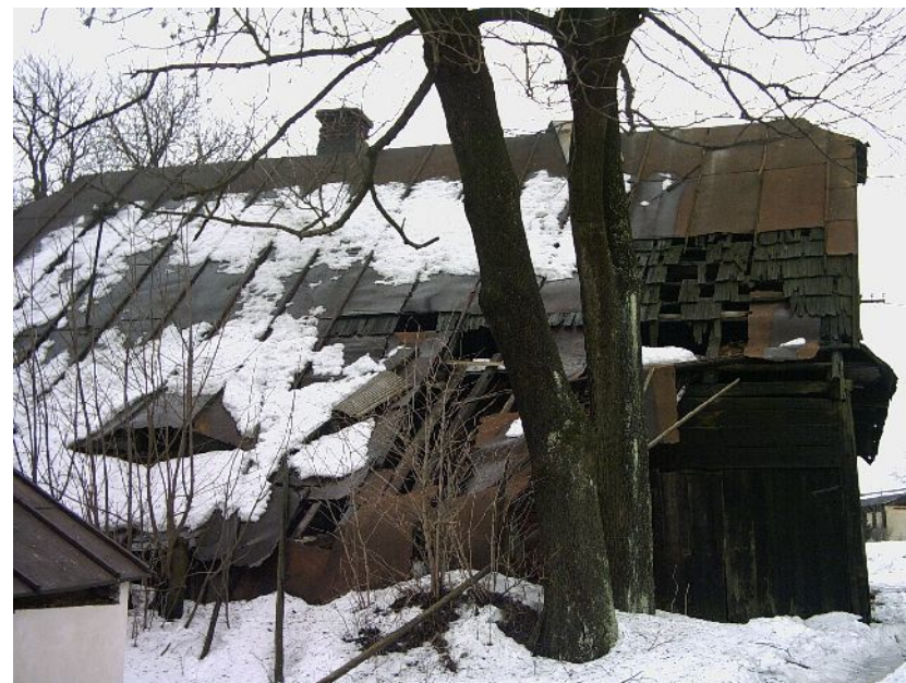
Čp. 11 Mezileší

Letitý problém s tímto obecním domem, co se týče bezpečnosti bydlení a narušování okolí svým vzhledem, bude konečně vyřešen. V tomto stavu je nemožné, aby v něm mohl z bezpečnostních a právních důvodů kdokoliv bydlet. Protože oprava by se už nevyplatila, bude v jarních měsících tato stavba odstraněna.