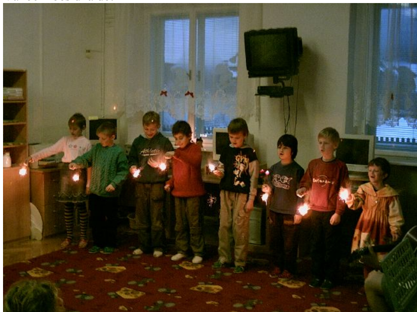
Vystoupení dětí při otvírání jesliček