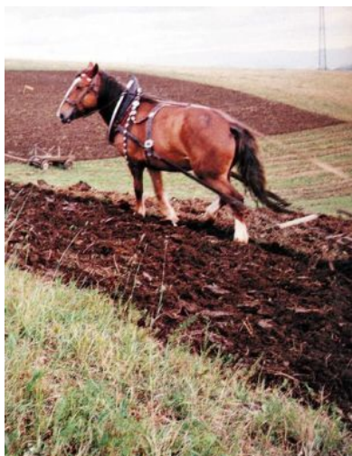
Podzimní práce na polích