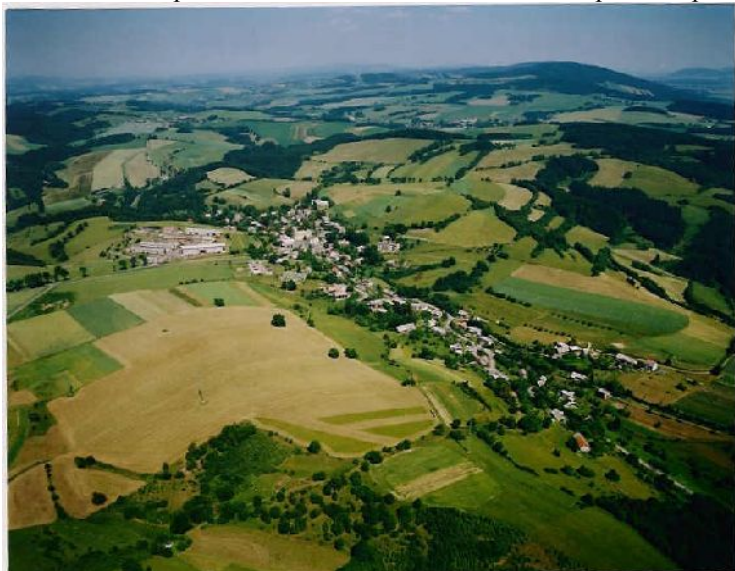
Letecký snímek části obce Cotkyně