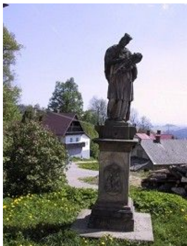
Socha sv. Jana Nepomuckého