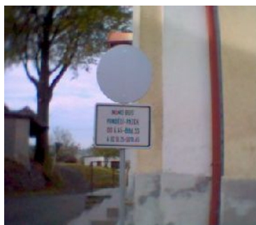
Sklopená značka ( neplatná ).

Od 1. listopadu začíná zimní období a z důvodu bezpečné jízdy autobusu z Herbortic po Cotkytli v serpentínách bylo umístěno sklopné dopravní značení, které ve vyznačenou dobu zakazuje průjezd směrem do Herbortic. Pokud nebude sníh, bude dopravní značka sklopena, tudíž bude neplatná. Toto značení bylo instalováno na žádost řidičů ČSAD Ústí nad Orlicí. Porušení bude bráno jako dopravní přestupek a řešeno Policií ČR. Tímto se zamezí zpoždění autobusu a čekání na vyproštění autobusu díky bezohledným řidičům, kteří nepočkají, až autobus projede, nebo mu nedají přednost v kopci.