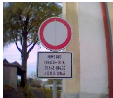
Odklopená značka ( platná ).