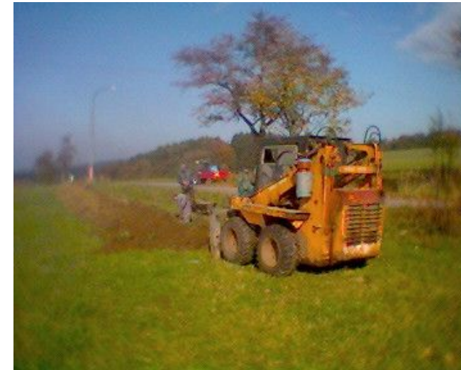
Pokládání nového kabelu.