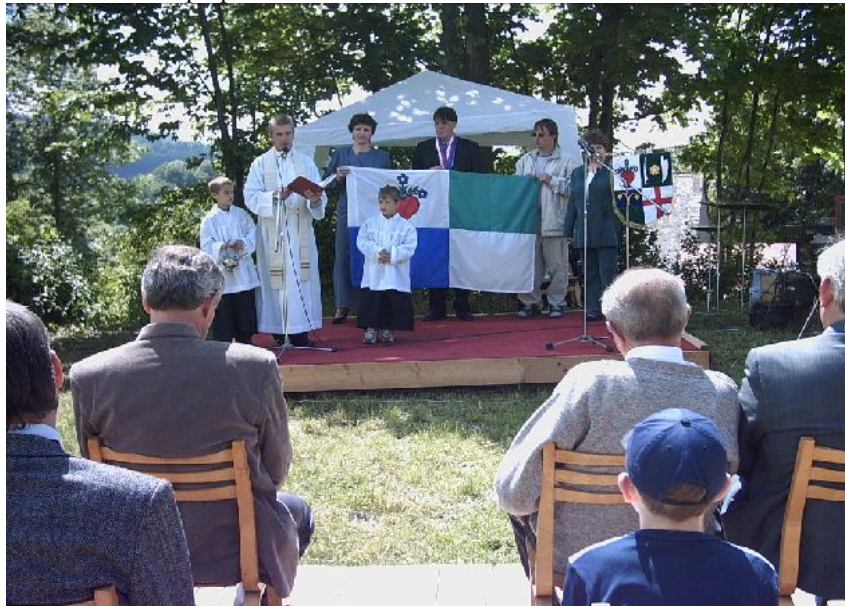
Vystoupení dětí ZŠ Cotkytle.