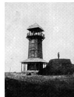
Mohyla Svatopluka Čecha a první rozhledna na Lázku z r.1912

Dnes je rozhledna Lázek soukromím majetkem a je otevřena o sobotách a nedělích. V letním období od června do srpna každý den. Stává se tak stále více vhodným cílem výletů pěších i mototuristů, kteří se rozhodnou navštívit tento kouzelný kraj na bývalé česko-německé národnostní hranici.