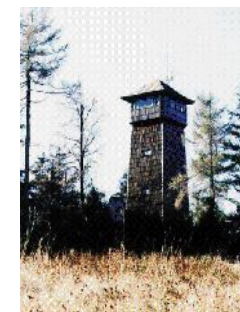
Dnešní rozhledna z r.2001